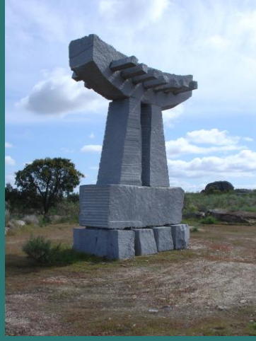
“Navegando pela alma”

“ Rota da Pedra ” em Alpalhão é um percurso pedestre urbano e rural de pequena rota (PR) com 2,5 quilómetros de comprimento em forma circular à volta da localidade. Com início e fim na Igreja matriz. Este itinerário de nível (1) fácil, tem como pontos de interesse, a zona da Judiaria, Caminhos de Santiago, Igreja matriz, Cantarias, Anta, conjunto de estátuas e uma instalação de pedra. São no total 17 estruturas para conhecer, aqui estão alguns exemplos.